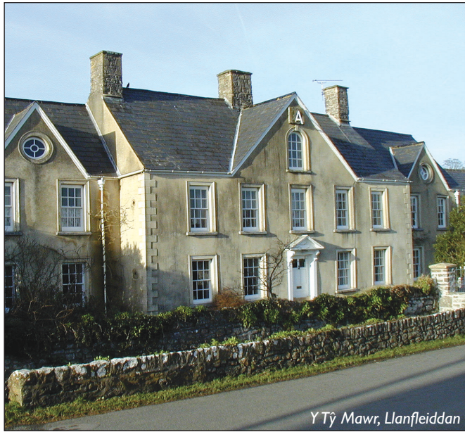
Y Tŷ Mawr, Llanfleiddan