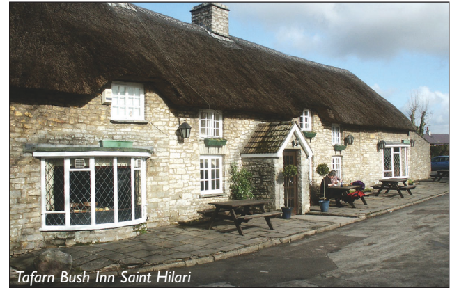
Tafarn Bush Inn Saint Hilari