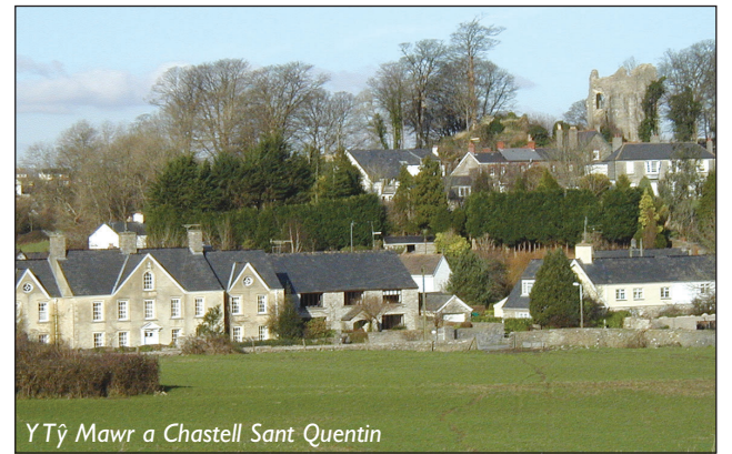
Y Tŷ Mawr a Chastell Sant Quentin

Mae Valeways wedi cyhoeddi teithlyfr Llwybr Treftadaeth y Mileniwm. Mae'r llyfr lliwgar hwn yn disgrifio 16 rhan y daith gerdded ac yn cael ei gyflwyno mewn pecyn sydd hefyd yn cynnwys 16 o fapiau A3 cyfatebol. Cewch ei brynu oddi wrth Valeways am £8.49 sy'n cynnwys cludiant a phacio.