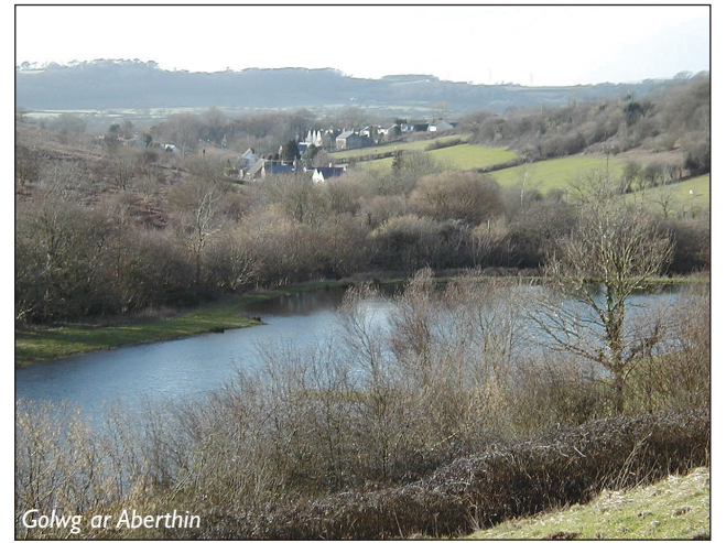
Golwg ar Aberthin