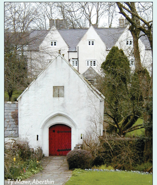
Tŷ Mawr, Aberthin

Pellter: 6 1/2 milltir (teithiau byrrach 5 3/4 a 3 milltir)