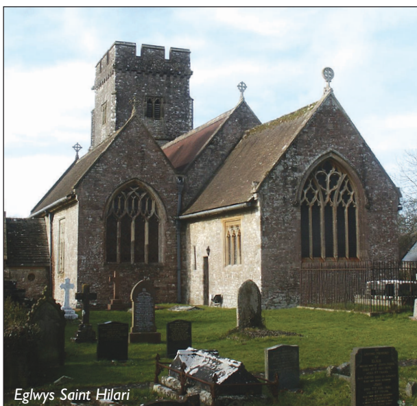
Eglwys Saint Hilari