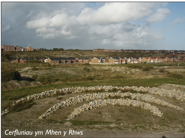
Cerfluniau ym Mhen y Rhws