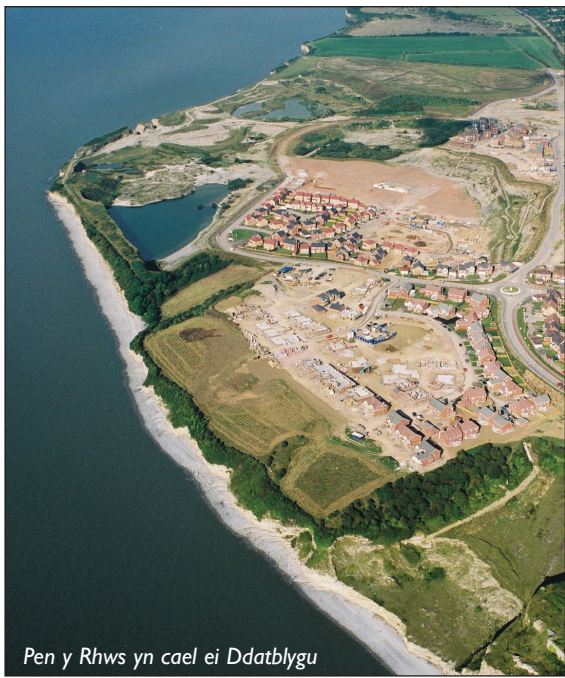
Pen y Rhws yn cael ei Ddatblygu