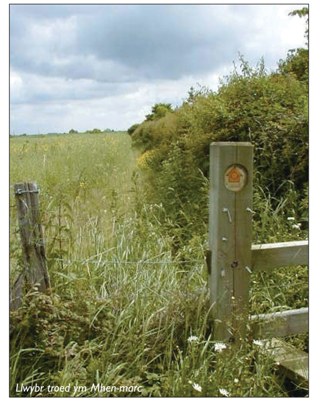
Llwybr troed ym Mhen-marc

Mae Valeways wedi cyhoeddi teithlyfr Llwybr Treftadaeth y Mileniwm. Mae'r llyfr lliwgar hwn yn disgrifio 16 rhan y daith gerdded ac yn cael ei gyflwyno mewn pecyn sydd hefyd yn cynnwys 16 o fapiau A3 cyfatebol. Cewch ei brynu oddi wrth Valeways am £8.49 sy'n cynnwys cludiant a phacio.