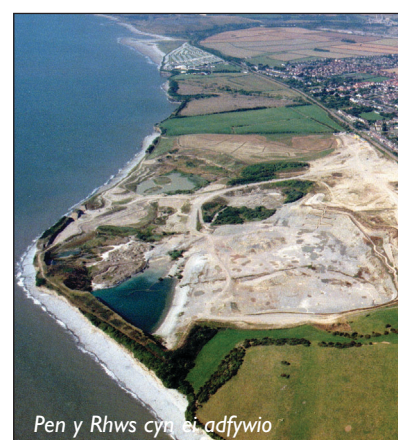
Pen y Rhws cyn ei adfywio

Trowch i'r chwith a cherddwch ymlaen ryw ychydig. Wedyn croeswch y ffordd brysur at y gamfa sydd gyferbyn â Gwesty Wellford Court. Ar ôl dringo dros y gamfa ddwbl honno ewch i'r dde gan gadw y postyn telegraff ar ganol y cae ar eich ochr chwith. Gwyrwch i'r chwith ac ewch i lawr y llethr i'r cae nesaf (bydd perygl llithro yma weithiau oherwydd y mieri a'r llaid). Ewch dros y gamfa ar eich ochr dde i mewn i gae agored. Ewch yn eich blaen i lawr y llethr. Byddwch yn cerdded heibio i bont fetel ar y chwith. Dyma ffordd hirach ond sychach o gyrraedd Parc Porthceri (gwelwch y llinell doredig ar y map). Cerddwch ymlaen ryw ychydig, croeswch i ochr chwith y nant ac ewch yn eich blaen i lawr y llethr a thros gamfa at goedwig fach. (Bydd y lle hwn yn gors o fwd ar dywydd gwlyb). Croeswch y nant wrth y bont newydd ac ewch i mewn i Barc Porthceri. Ewch i'r chwith ar hyd y llwybr ac o dan y draphont at y Caffi - a dyma chi wedi cyrraedd man cychwyn y daith gerdded.