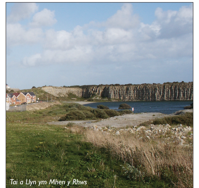
Tai a Llyn ym Mhen y Rhws