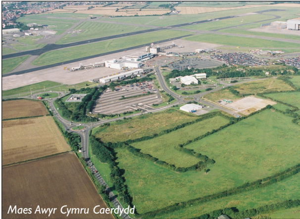
Maes Awyr Cymru Caerdydd