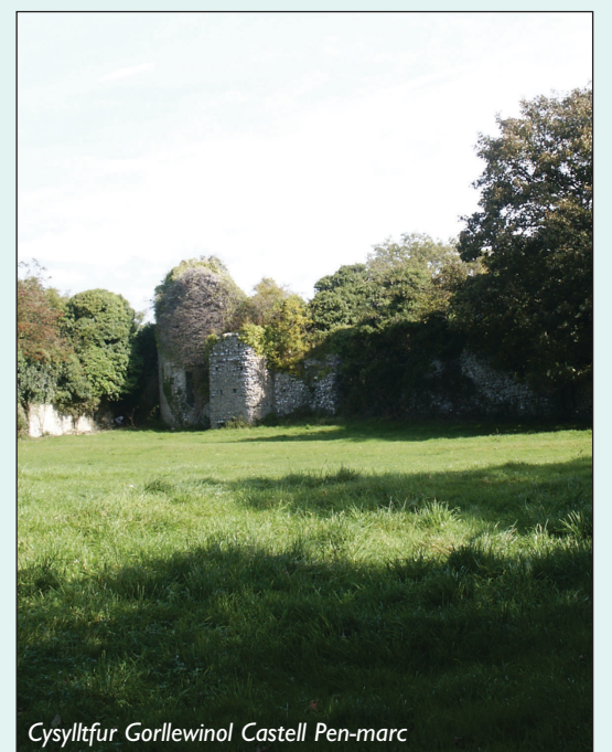
Cysylltŷfwr Gorllewinol Castell Pen-marc