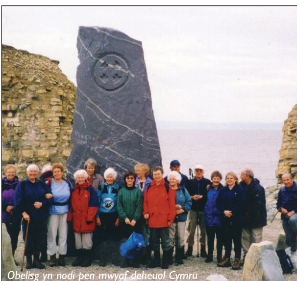
Obelisk yn nodi pen mwyaf deheuol Cymru