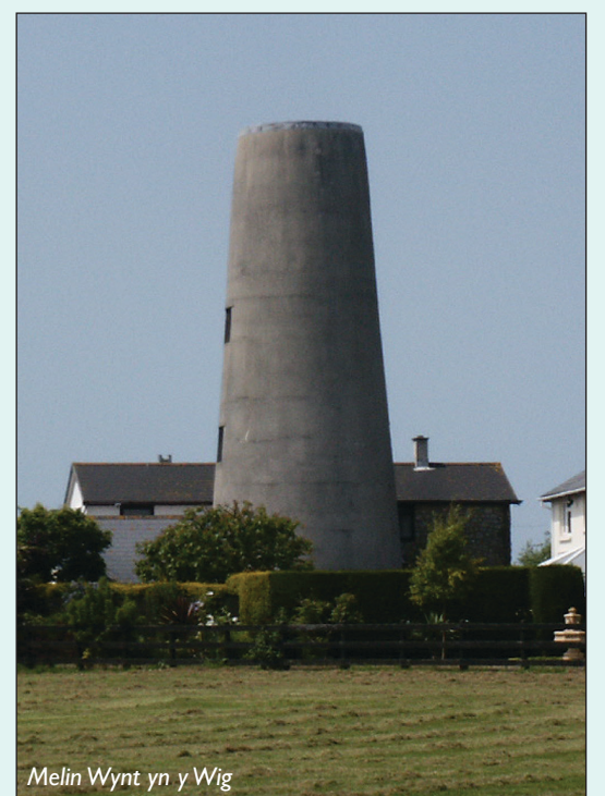
Melin Wynt yn y Wig