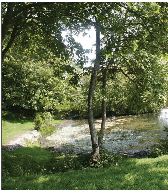
Pwll ychydig i'r gogledd i Llys Llanffa