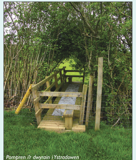
Pompren i'r dwyrain i Ystradowen

Pellter: 7 milltir (teithiau byrrach: 3.5 & 3 milltir)